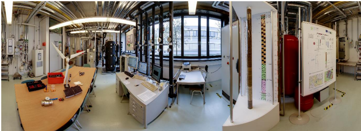
Bild 6 – Labor Gebäudeenergietechnik

Auch zu Hause spielen erneuerbare Energie eine immer größere Rolle. Aus diesem Grund beschäftigt sich das Labor für Gebäudeenergietechnik mit Lösungen für verschiedenste Anwendungen. Unter anderem forscht das Labor zu den Themenfeldern Geothermie, Photovoltaik, Gebäudeintegrierter Windkraft, Energiespeicher und hybrider Energieversorgung.