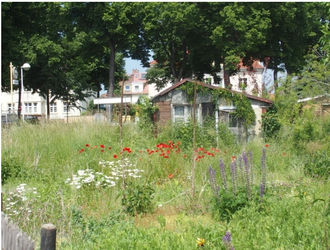
Bild 12 – Kleingartenverein

Wer möchte kann die Tour in der Kleingartenanlage ausklingen lassen z.B. auf der Blüh- und Streuobstwiese oder dem Barfußweg.