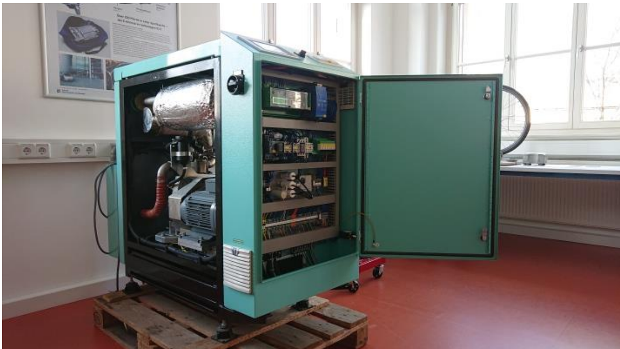
Bild 4 – Blockheizkraftwerk

Besichtigungen für Gruppen sind auf Anfrage möglich.