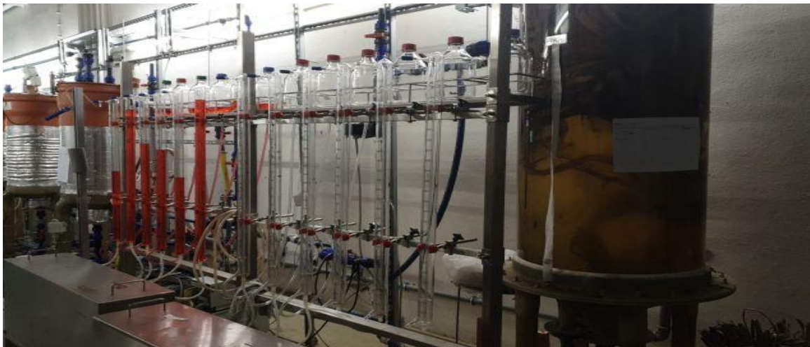
Bild 10 – Labor

Besichtigungen sind mindestens 14 Tage vor dem geplanten Besuch schriftlich oder telefonisch anzumelden. Tel.: +49 3583 612 4944 oder per E-Mail: m.tirsch@hszg.de