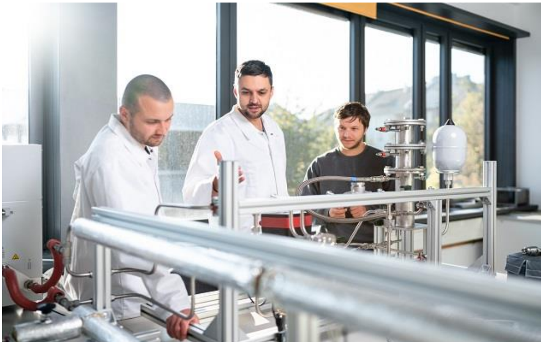
Bild 5 – Labor Thermodynamik